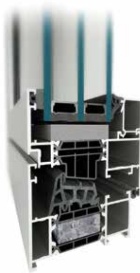
Okna MB-79N SI