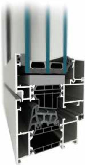
Okna MB-79N ST